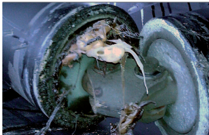
Ciche krążniki z Belchatowa

Walne Zebranie Delegatów podjęło decyzję o poszerzeniu Zarządu Regionu o dodatkową osobę z nowo utworzonej Komisji Zakładowej zgodnie z przyjętą wcześniej uchwałą Walnego Zebrania Delegatów w roku 2013.