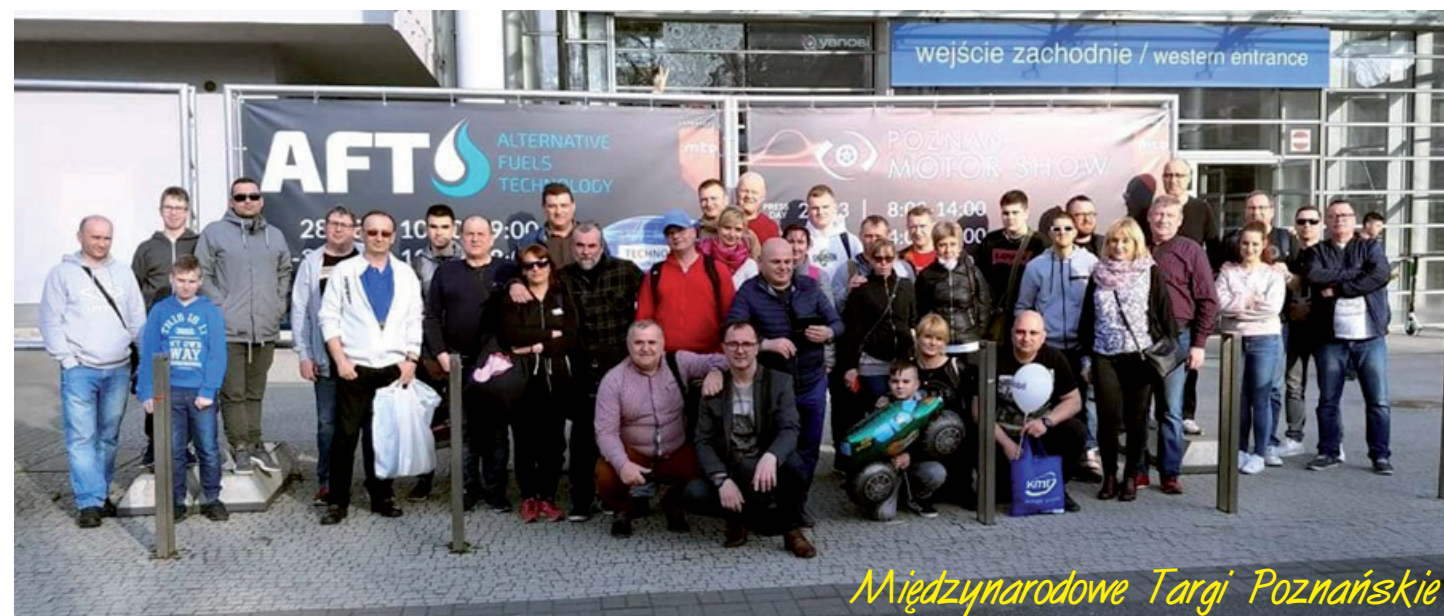
Międzynarodowe Targi Poznańskie