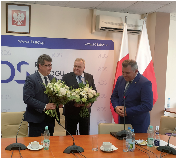
TABELA STAWEK WYNAGRODZENIA ZASADNICZEGO PRACOWNIKÓW PGE Górnictwo i Energetyka Konwencjonalna S.A. Oddział Kopalnia Węla Brunatnego Turów

Przestrzeganie zasad to jedno, ale poprawienie i udoskonalenie warunków w których pracujemy to druga strona medalu. Nasza Komisja wysłuchuje wszystkie uwagi od pracowników i stara się je zgłaszać odpowiednim służbom. W ostatnim czasie to były: uszczelnienie przeciekających świetlików na hali na m-3, uzupełnianie środka do dezynfekcji stóp na łaźni głównej oraz wymianę tych urządzeń, wyjaśnialiśmy przyczyny braku ciepłej wody na łaźni głównej, klimatyzacja autobusów linii 74,72,34,70, założenie klimatyzacji w pomieszczeniu obsługi na przepompowni T6.