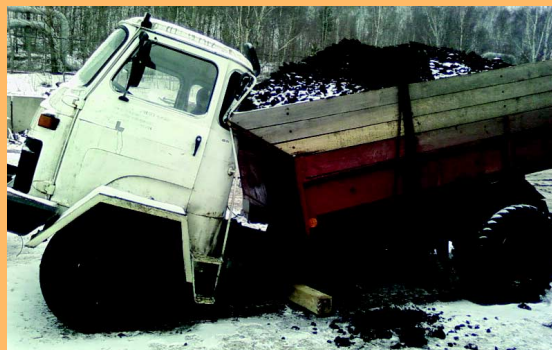
Foto przestroga - prosto z rampy węglowej

Tak. Pracownik ojciec dziecka może wykorzystać urlop ojcowski w każdym czasie. Jedynym ograniczeniem jest wiek dziecka (12 miesięcy). Nie ma zatem żadnych przeszkód, aby ojciec wykorzystał to zwolnienie podczas korzystania przez matkę dziecka z urlopu macierzyńskiego.