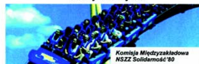
Komisja Międzyzakładowa NSZZ Solidarność'80

Zapraszamy do wspólnego spędzenia czasu i miłej zabawy !!!!